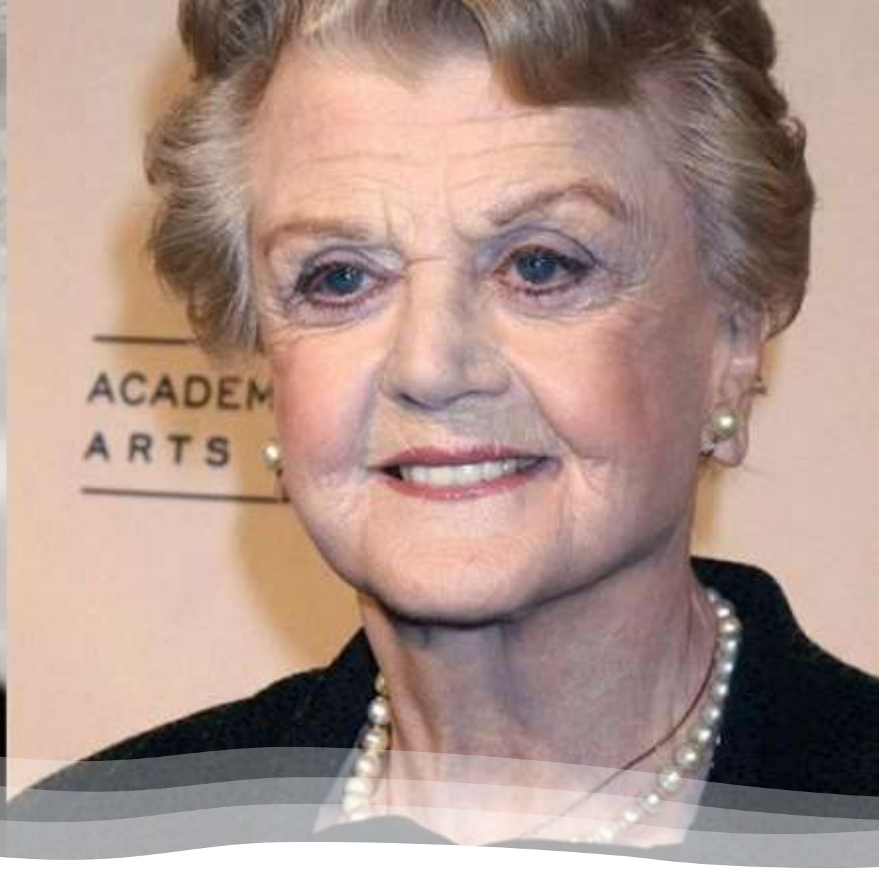
Angela Lansbury, 95 años