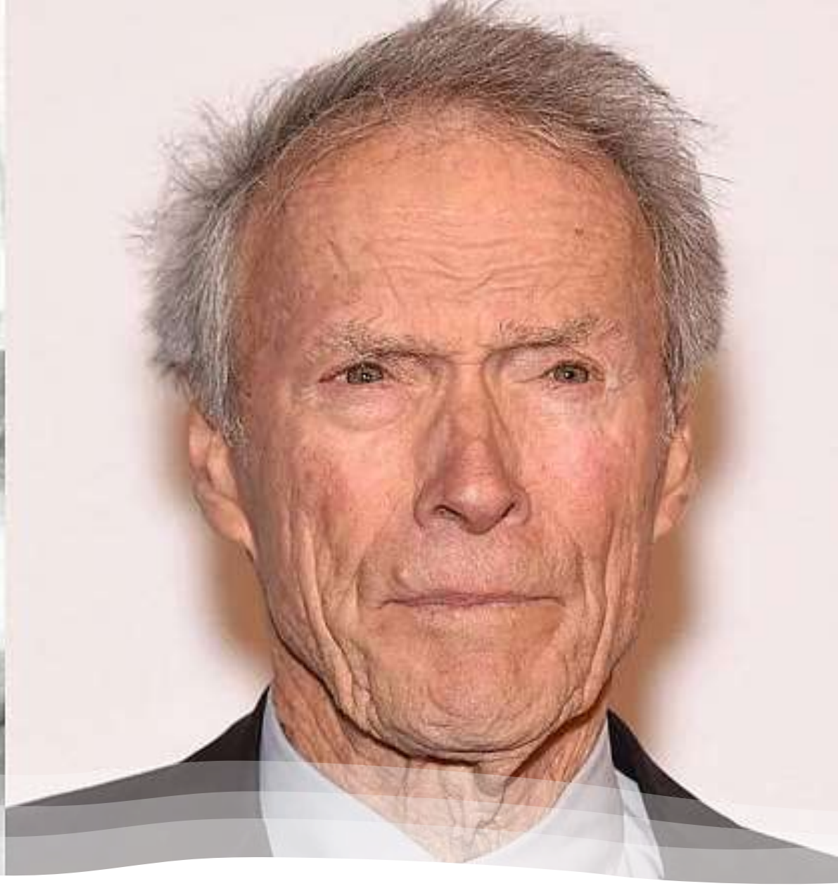
Clint Eastwood, 91 años